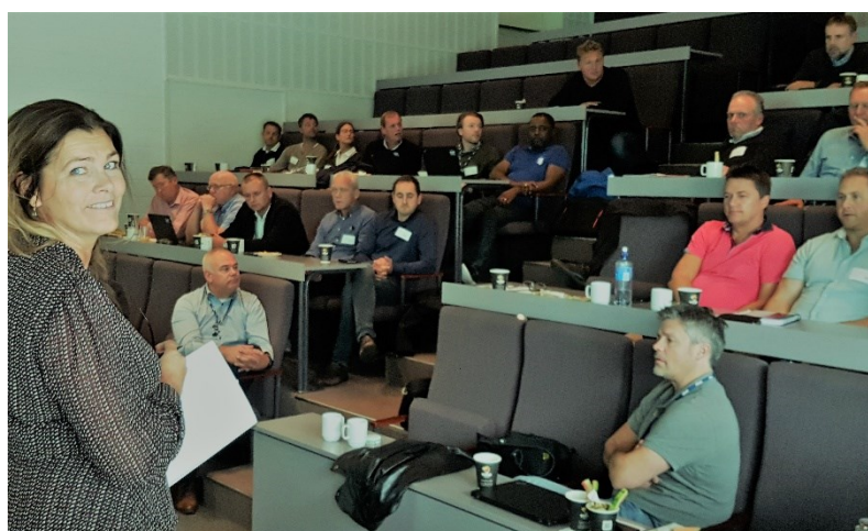
Oppstartsmøte produksjonsplanlegging 19.september

Styret arbeidet fra starten av året med å klargjøre hva Samarbeidsavtalen sier om produksjonsplanlegging. Vi fikk tydeliggjort hvordan dette skal fungere, og fikk alt på plass i god tid før produksjonsplanleggingen for 2018 skulle starte. Coop kalte etter sommeren inn alle tillitsvalgte i Nordgrønt og innkjøpsansvarlige rundt om i landet til et oppstartsmøte for produksjonsplanleggingen. Videre utover høsten gikk det aller meste på skinner i dette arbeidet. Og planene ble sendt ut i rett tid.