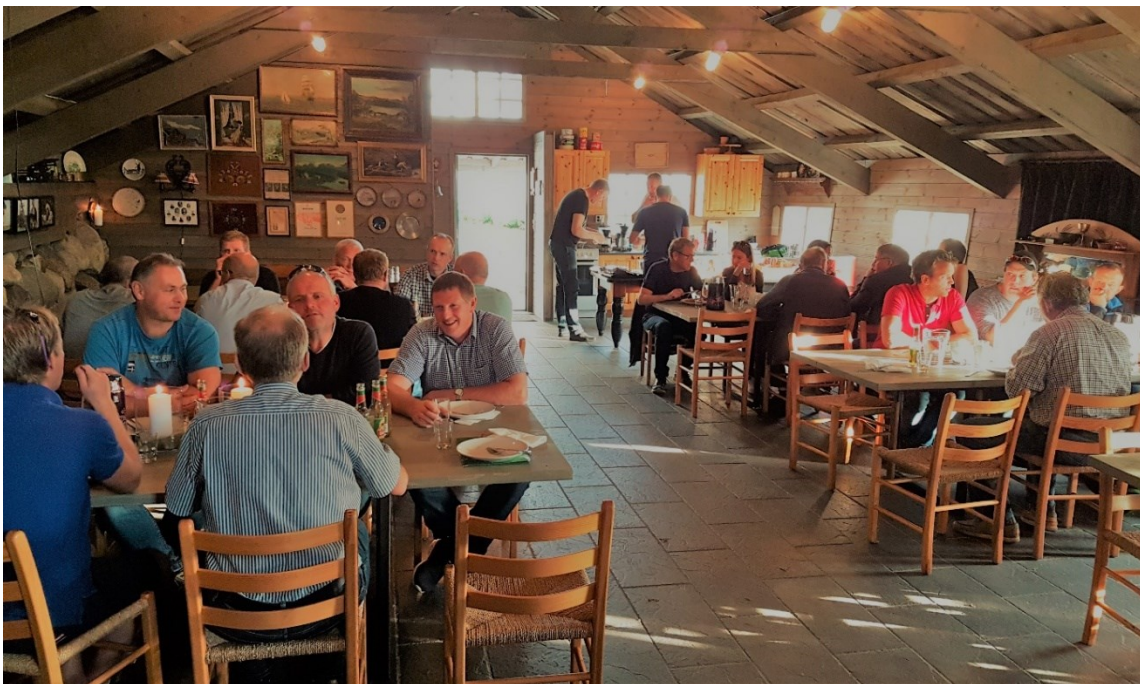
Medlemsmøte i forbindelse med et styremøte i Rogaland.

Gjennom året er det som vanlig tatt opp en del nye medlemmer i Nordgrønt. Dette både via generasjonsskifter og via oppryddinger i noen uklarheter fra tidligere.