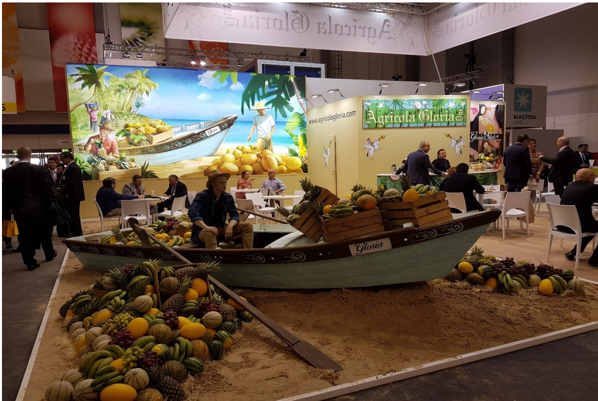
Fra Fruit Logistica i Berlin.

Tidlig i februar inviterte styret med seg F&G-ansatte i Coop på tur til Fruit Logistica i Berlin. Formålet var både å få sett på hva som rører seg i bransjen i verden. Men også for å lage en arena der vi kunne bli bedre kjent med hverandre og lære av hverandre. Turen ble vellykket.