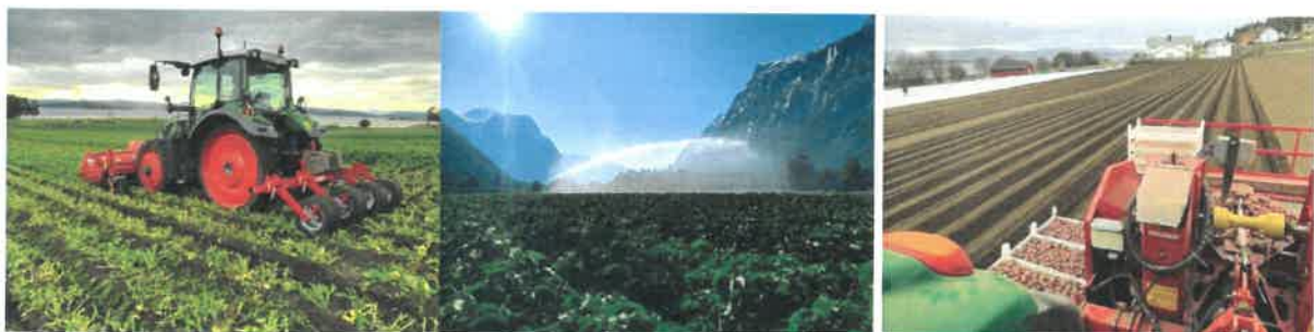
Mekanisk fjerning av potetris (Skogn)

Vi takker for et godt samarbeid og ser frem mot ny potetsesong.