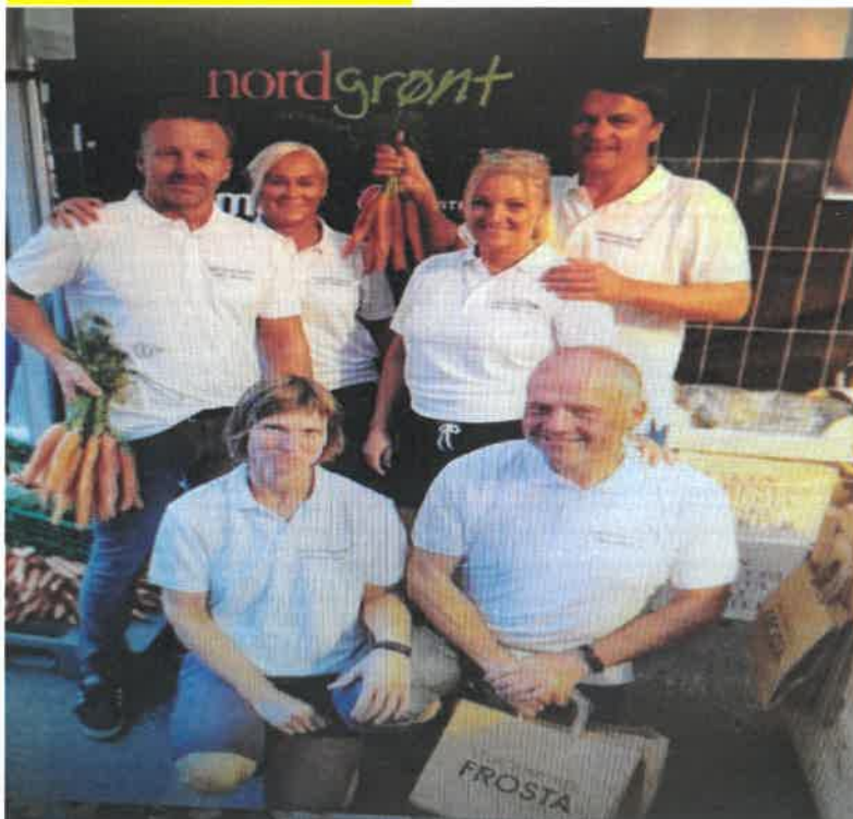
Bilde fra Trøndersk matfestival.

Det er 3 festivaler som peker seg ut. Trøndersk matfestival i Trøndelag. Matstreif på Østlandet. På Vestlandet er det en festival som heter Gladmatfestivalen. Både Coop og Nordgrønt bidro med støtte til festivalen i Trøndelag. Dette etter søknad/forespørsel fra produsenter som deltok på stand der. Ingen søknader mottatt fra de 2 andre festivalene. Viktig forutsetning ved slike festivaler er at man kan hente ut fordeler ved å bidra. Må gi noe tilbake. Noen må også være villige til å delta. Kan være produsenter og/eller Coop. Viktig å kartlegge dette i forkant. Regionstyret/regionleder i hver region kan ha ansvar for organiseringa. Planer rundt dette må legges i forkant, så tidlig som mulig, slik at Coop kan legge inn evt. støtte i sine budsjetter.